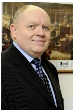
René DOSIERE Président de l'observatoire de l'éthique publique Membre honoraire du Parlement