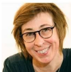
Stéphane HOREL journaliste d'investigation au Monde, spécialiste du lobbying