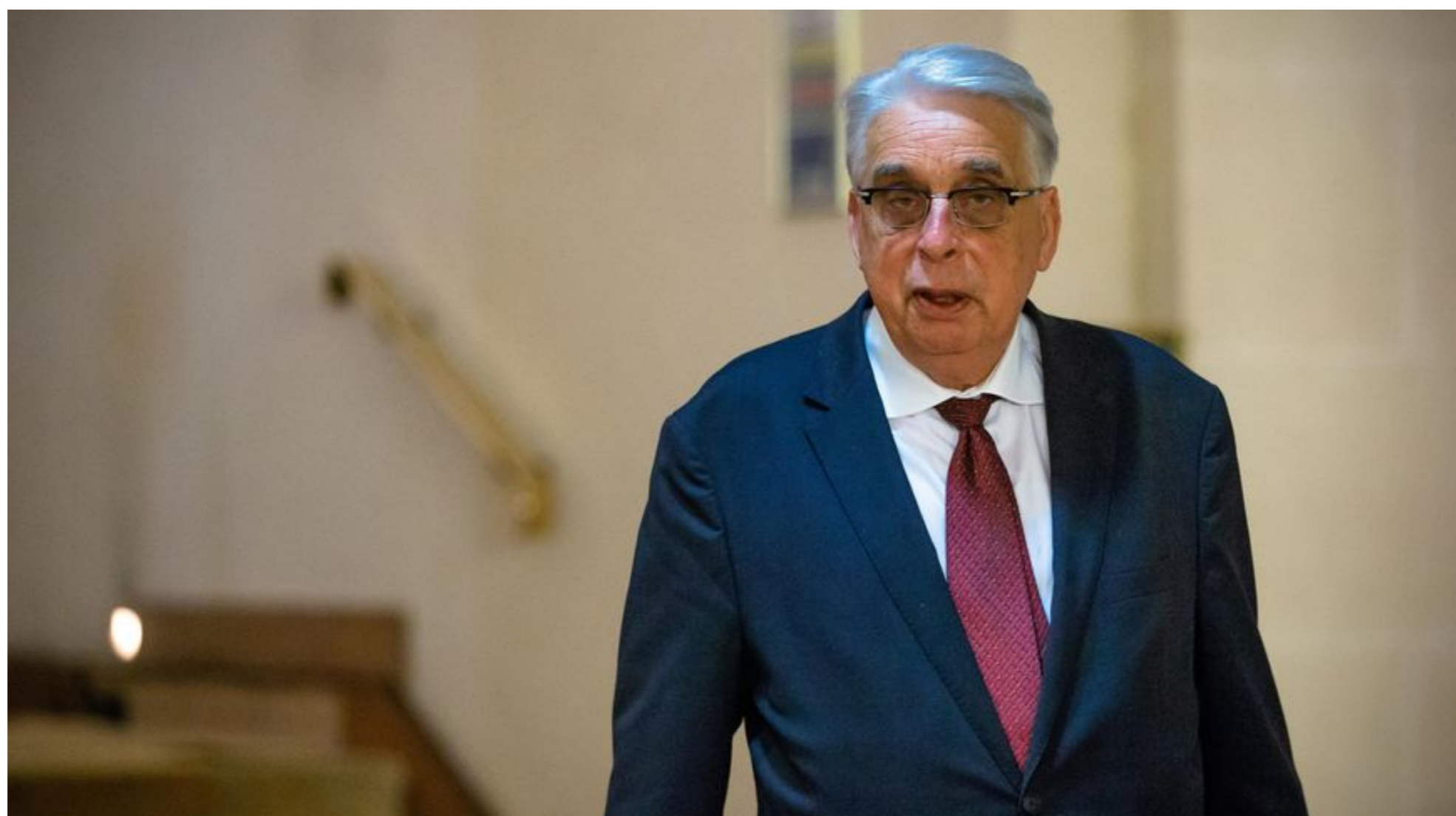
Jean-Pierre Sueur, sénateur du Loiret, en juillet 2020

Le sénateur socialiste du Loiret Jean-Pierre Sueur devient questeur du Palais du Luxembourg. L'ancien maire d'Orléans a été désigné par son groupe pour occuper ce poste important dans les rouages du Sénat, puisque les questeurs ont en charge le budget et toute l'administration de la Chambre haute.